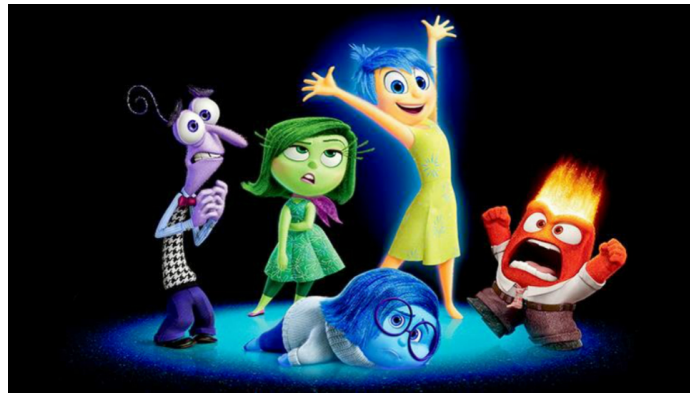
Inside Out, Pixar (2015)

Tarinankerrontaa käytetään markkinointikeinona, mutta myös fiktiossa. Esimerkiksi Pixar on tunnettu piirretyistä tarinoistaan.